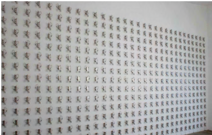
Pe Lang & Zimoun, Untitled Sound Objects, Bon Accueil, 2008

Installation sonore : 450 pendules électro-magnétiques.