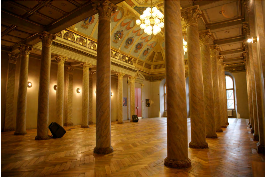
Mademoiselle, vous allez terriblement me manquer ! (Première version : Pièce sonore pour 6 haut-parleurs et 6 gyrophares). Exposition à Vychodoslovenska Galeria ( Kosice - Slovaquie) novembre 2009