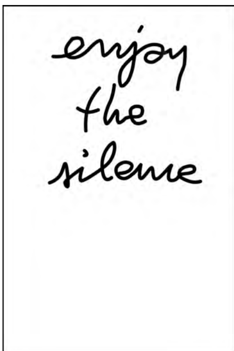
Enjoy The Silence , Feuille d'acier et découpe laser. Exposition : « Optical Sound ». Galerie Frédéric Giroux Paris.