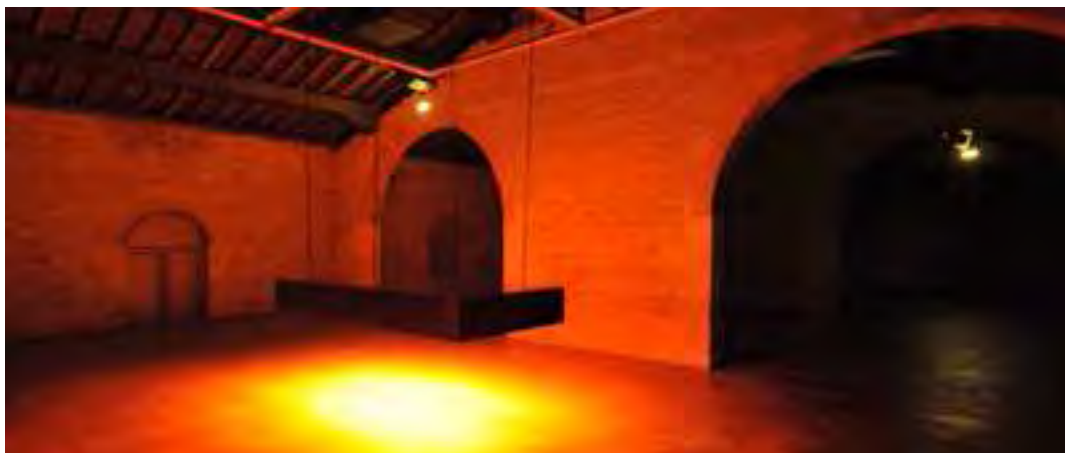
Stressful Light , Installation sonore immersive pour 26 HP et structure lumineuse suspendue. CAPC Musée d'art contemporain de Bordeaux Octobre > Décembre 2008