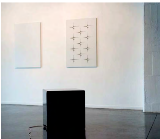
Millimetric , Installation sonore, FRAC Collection Aquitaine, Exposition Caprice des Jeux, juillet > octobre 2008