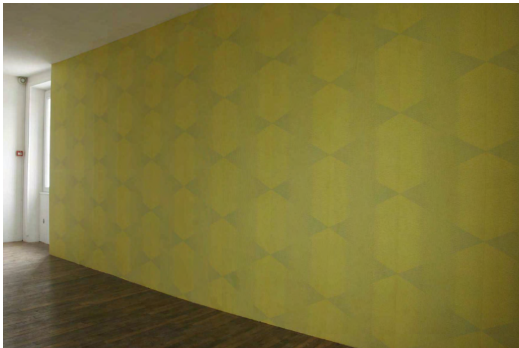
Sébastien Roux / Cocktail Designers, Wallpaper Music, Bon Accueil 2009

Installation sonore : 450 pendules électro-magnétiques.