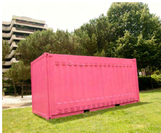
Closer , Installation sonore dans l'espace public, Bordeaux, 2009