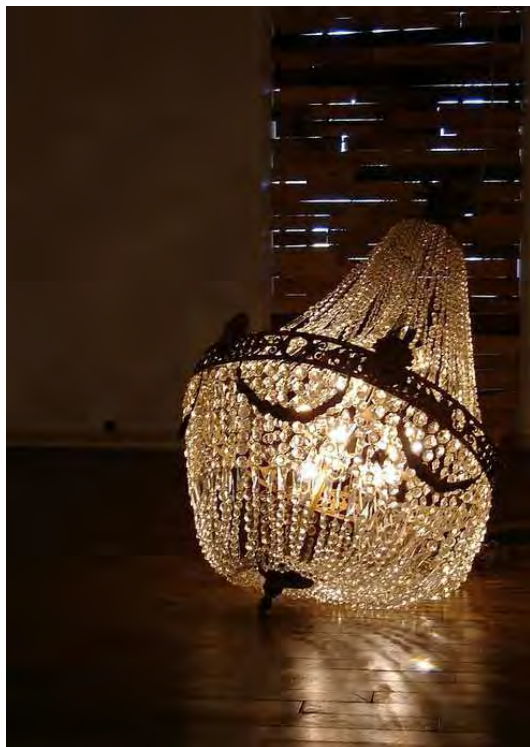
Exposition Licht / Klang, octobre 2010 Installation sonore : Lüster , Tilman Küntzel , lustre à pendeloques, starters, micros contact, amplis, 20 HP