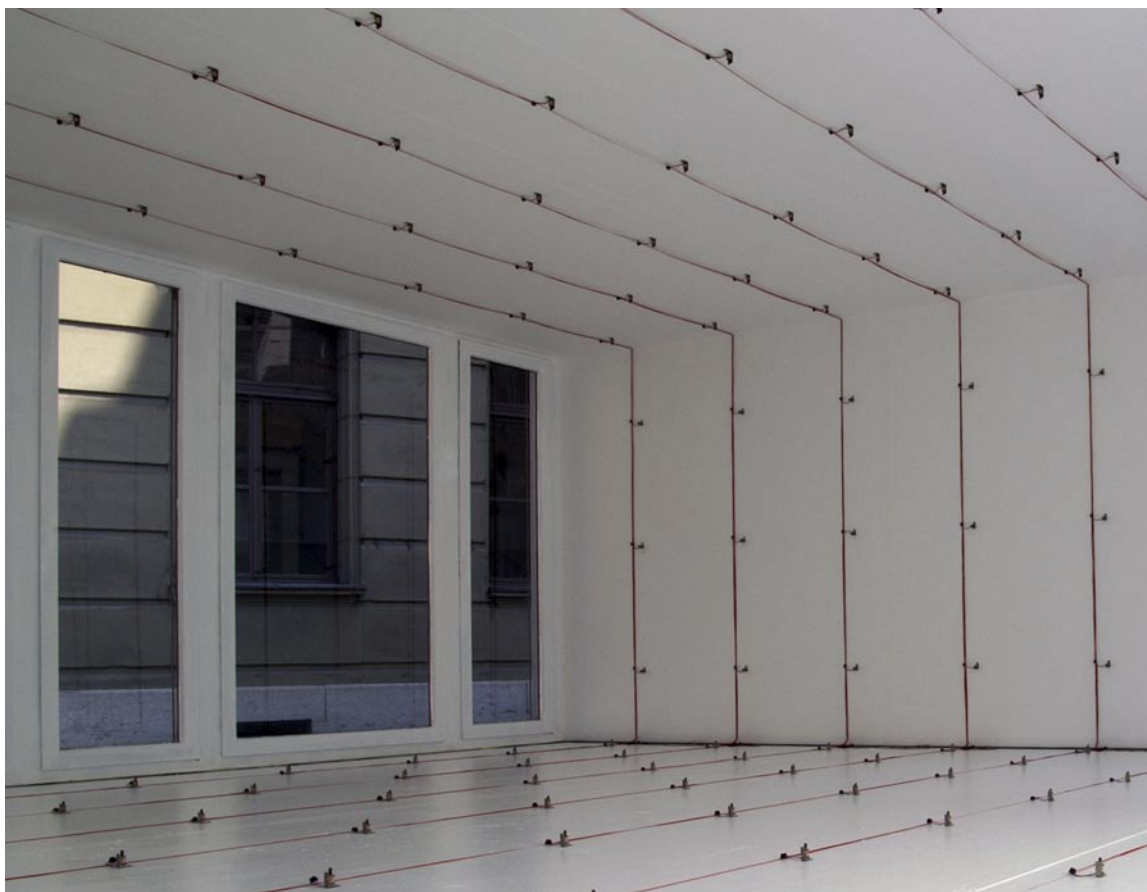
Untitled Sound Objects / Pe Lang & Zimoun