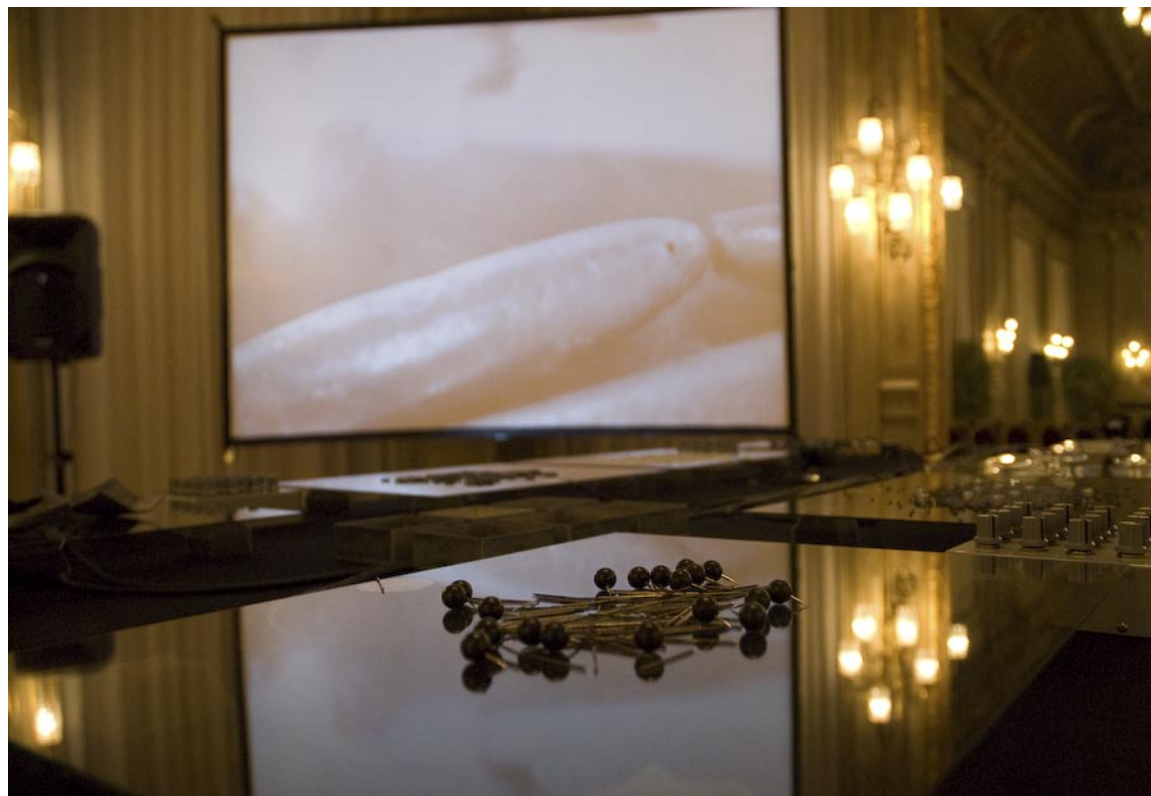
Untitled Sound Objects / Pe Lang & Zimoun